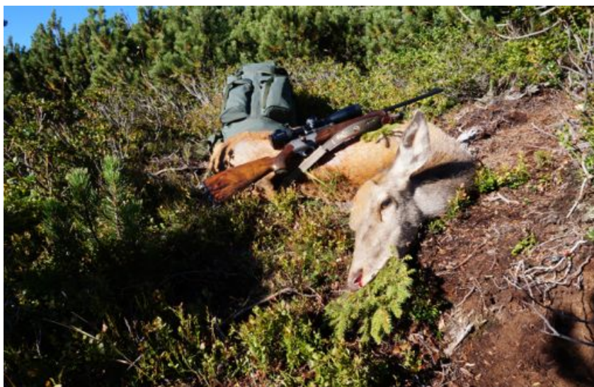
Foto foro d'entrata (non ho la foto della spalla rovinata perchè non ho pelato io l'animale):